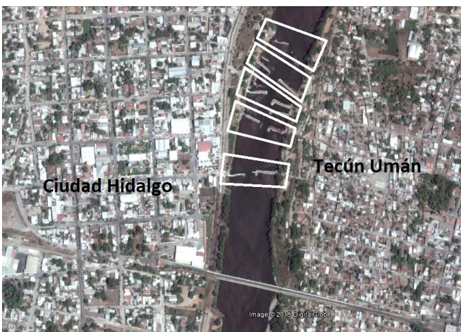
Image 3 : les différents lieux de passage en marge du pont international.

On trouve donc, aux abords du pont international, différents lieux de passage irrégulier – il y en a cinq principaux entre les deux localités, et d'autres plus isolés et moins concourus en amont en aval – où opèrent ces organisations de balseros . La segmentation de la rive du fleuve en micro-espaces de travail et la définition de couloirs fluviaux constitue le produit de la relation et des interactions entre les différents groupes qui sont à la fois en compétition, mais également dans l'obligation d'instaurer une certaine coopération. Nous y reviendrons ultérieurement.