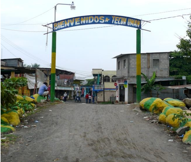
Image 4 et 5 (ci-après) : l'entrée à Tecún Umán depuis l'un des principaux lieux de passage informel aménagé antérieurement à la construction des ponts internationaux (à gauche) ; arrivée à Tecún Umán par le pont international Dr. Rodolfo Robles (à droite). Photos personnelles, 2013.

À partir des années quatre-vingt et quatre-vingt-dix, le gouvernement mexicain durcit le ton, ce qui n'est pas sans rapports avec l'intensification des flux migratoires et commerciaux, les améliorations quant aux transports et communications (qui ouvrent de nouvelles possibilités de mobilité transnationale), et les programmes bilatéraux de coopération avec les États-Unis en matière de sécurité et de défense. Dès lors, certaines pratiques, largement tolérées durant des décennies, sont devenues répréhensibles et ont été de ce fait périodiquement sanctionnées 10 . Toutefois, si celles-ci sont dévalorisées dans les discours de l'État national à partir d'un moment donné, elles sont restées empreintes de normalité pour la population locale, d'autant plus qu'il y a un phénomène de reproduction sociale de ces pratiques de génération en génération depuis presque un siècle, à l'image de