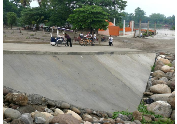
Image 8 : Rampe d'accès en béton permettant l'accès à la rive. Photo personnelle, avril 2013.

À la suite d'autres négociations, tous les lieux informels de transit sont rétablis et les accès à la rive du fleuve sont reconfigurés : en 2012, en période de campagne électorale, sont construites des rampes d'accès pour que les piétons, les tricycles, et également les véhicules motorisés puissent passer le mur de soutènement et gagner la rive du fleuve. Signalons que le principal argument des diverses organisations a été celui du respect des « us et coutumes » ; en effet, l'État mexicain reconnaît dans sa constitution certaines formes d'autogouvernement et coutumes (qui prévalent dans la plupart des cas dans des communautés indigènes).